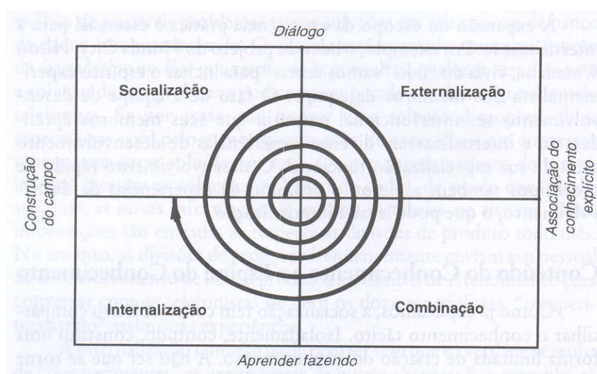
Figura 2 ESPIRAL DO CONHECIMENTO

Fonte: NONAKA e TAKEUCHI, Criação de Conhecimento na Empresa . 1997, p. 80.